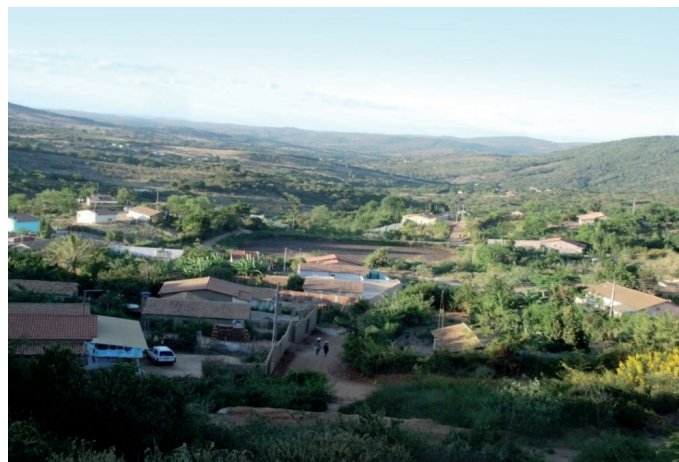
Figura 1. Vista da parte baixa da comunidade. Figure 1. View from lower area of the community.

Segundo dados disponíveis no site do INCRA (2017), na Bahia apenas 25 comunidades possuem seus territórios regularizados, sendo duas comunidades em Vitória da Conquista: Velame e Barreiro do Rio Pardo. Tal dado revela que a regularização fundiária é uma das principais reivindicações das comunidades quilombolas na atualidade 5 .