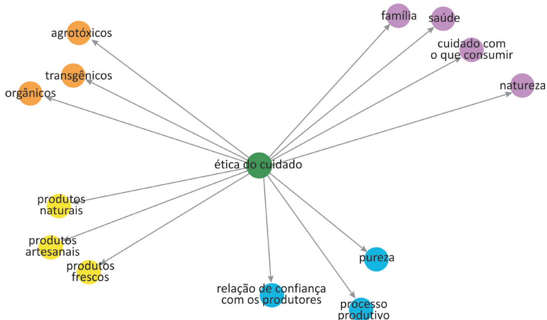
Figura 1. Categorias associadas à ética do cuidado.

Sob esta ótica, as práticas de consumo focalizadas no presente estudo parecem se aproximar em alguma instância dos achados destes autores. Em virtude disso, as demandas dos consumidores da feira de economia solidária por produtos "naturais" e "saudáveis" compõem um lugar importante em suas justificações, fazendo parte fundamental de sua racionalidade axiológica: