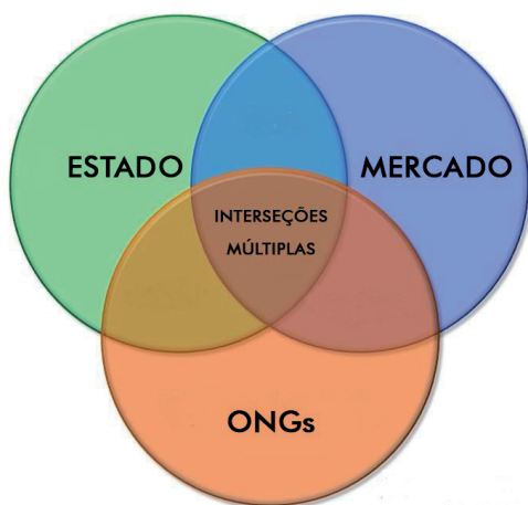
Figura 1. Interseções entre os três setores da sociedade. Figure 1. Intersections among the three society sectors.

Com essas representações hipotéticas queremos dizer que, no plano das agências de cooperação internacional, por vezes, torna-se difícil escriturar instituições como sendo do terceiro setor 10 , quando, em verdade, muitas são organizações parale-